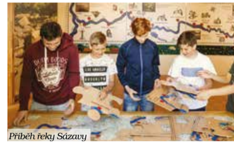
Příběh řeky Sázavy