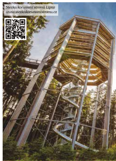
Stezka korunami stromů Lipno www.stezkakorunamistromu.cz

Z Království leša je na dohled majestátní věž bezbariérové Stezky korunami stromů. Z ní je krásný výhled na jezero, okolní Šumavu, a při dobré viditelnosti až na vrcholky Alp vzdálené 200 kilometrů. Při procházce do korun stromů potkáte adrenalinové zastávky, na kterých vyzkoušíte balanc i odvahu. Po celou cestu vás bude doprovázet zábavná a vzdělávací Ptáčí stezka. Dřevěné sošky šumavských opeřenců s informačními tabulemi i originální hnízda s vajíčky jednotlivých ptáků. Na vrcholu věže pak zpívají ptačí hodiny. Cestu zpátky z vrcholků stromů na pevnou zem si můžete zkrátit 52 metrů dlouhým tobogánem. Právě tam, kde na něj budete nastupovat, se během léta střídají mnozí více i méně známí hudební interpreti. Úterní večery totiž na Lipně patří romantickým západům slunce a tradičním koncertům na Stezce. Jejich atmosféra je neopakovatelná. Stezka korunami stromů Lipno je první stezka svého druhu v České republice. Postavena byla v roce 2012 a od té doby je oblíbeným cílem návštěvníků jižních Čech. Je bezbariérová a otevřena 364 dní v roce.