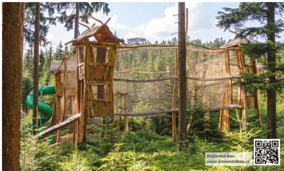
Království leša www.kralovstvollesa.cz

Ke Království patří také Malá lesní zoo se vzácnou kočkou divokou, veverkami, puštíkem obecným i výběhem s kozičkami. Načerpání síly na další dovádění lze v Lesních dílnách Modřínek, které jistě přilákají malé i velké řemeslníky. Na památku si odtud odnesou nejen skvělé zážitky, ale také vlastnoruční výrobky z přírodních materiálů, které jsou běžně v lese dostupné. Celé hřiště a jeho prvky jsou inspirovány životem v lese a děti se tak nejen dostatečně unaví, ale naučí se i mnoho zajímavostí z lesní říše.