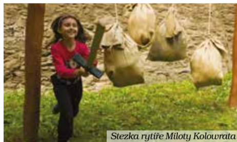
Stezka rytíře Miloty Kolowrata