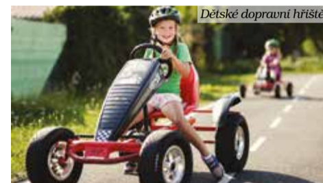
Dětské dopravní hřiště